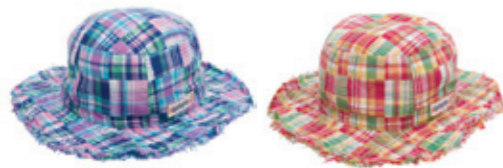
#65022 パッチワーク 二重織り サファリハット ¥3,900 (税込¥4,095)