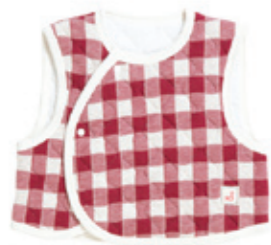
#45006 H-S-L チェック接結キルト ベビーベスト ¥2,900 (税込¥3,045)

XS (50-70cm) SS (70-80cm) 表地・裏地: 綿100% 中綿: ポリエステル100% 日本製 秋冬春