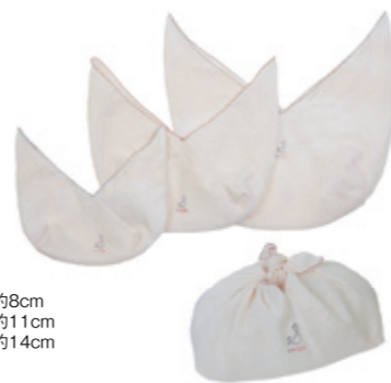
ラッピングに使ったあとは、弁当箱入れや おむつ入れなどに使えるのでエコ