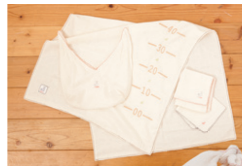
#95009 H-S-L ガーゼ ベビー入浴セット 3点+あづま袋 ¥3,800 (税込¥3,990)