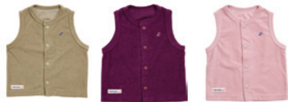
#45009 T/C パイル ベスト ¥2,700 (税込¥2,835)