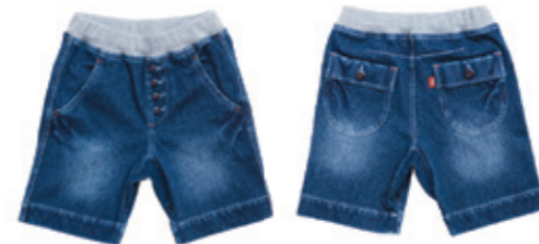
#55006 ストレッチ スラブニットデニム ハーフ丈 コンフォートパンツ ¥3,800 (税込¥3,990)