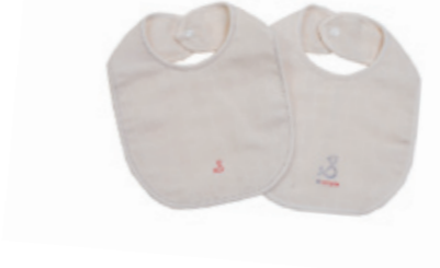
#65005 H-S-L ガーゼ スタイ 2枚組 ¥1,300 (税込¥1,365)

A サックスボーダー1枚 アカボーダー1枚 B パープルボーダー1枚 グリーンボーダー1枚 C ピンクドット1枚 イエロドット1枚