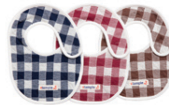
#65025 H-S-L チェック接結天竺 スタイ ¥1,000 (税込¥1,050)