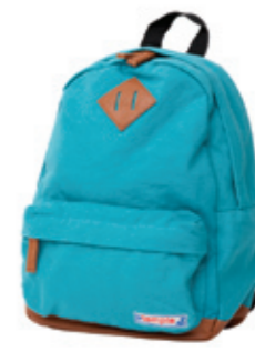
#65018 コットン帆布 キッズ DAY バック S ¥2,900 (税込¥3,045) タテ約30cm × ヨコ約21cm × マチ約10cm

M ¥3,300 (税込¥3,465) タテ約36cm × ヨコ約24cm × マチ約12cm