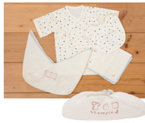
#95011 H-S-L ベビー プチギフト 3点+あづま袋 ¥3,600 (税込¥3,780)