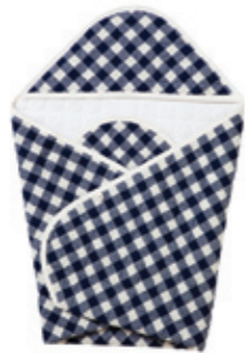
#65012 H-S-L チェック接結キルト アフガン ¥4,700 (税込¥4,935)