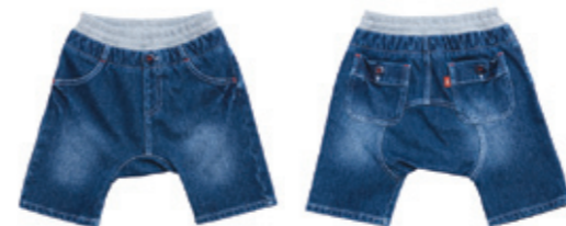
#55008 ストレッチ スラブニットデニム 7分丈 ラウンドパンツ ¥3,600 (税込¥3,780)