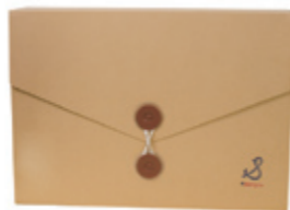
#95005 スタンプ ギフトBOX オープンブライズ