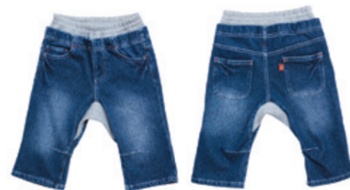
#55007 ストレッチ スラブニットデニム 8分丈 コンフォートパンツ ¥3,800 (税込¥3,990)