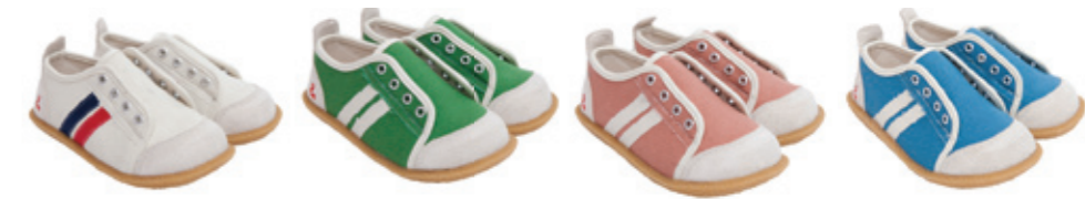
#75031 キャンバス スリッポンシューズ ¥2,900 (税込¥3,045)

13.0, 14.0, 15.0, 16.0, 17.0, 18.0, 19.0cm 中国製