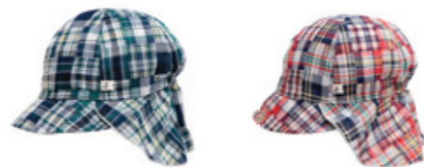
#65020 パッチワーク W ガーゼ バオバブキャップ ¥2,900 (税込¥3,045)

XS(42-44cm), SS(46-48cm), S(50-52cm) 綿100% 日本製