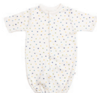
#25008 フライス ドットPt 7分袖 2WAY オール ¥3,300 (税込¥3,465)

XXS (50-60cm) XS (60-70cm) 綿100% 日本製 春夏秋冬