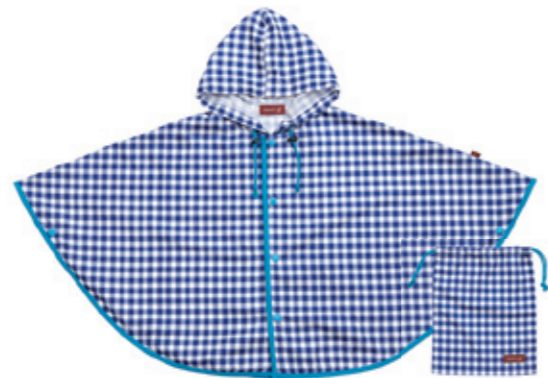
#65016 ギンガムチェック レインポンチョ きんちゃく付 ¥3,400 (税込¥3,570)