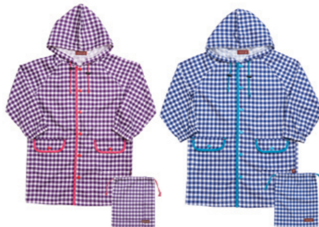
#65015 ギンガムチェック レインコート きんちゃく付 ¥3,800 (税込¥3,990)

M (85-95cm) L (100-110cm) LL (120-130cm) ポリエステル100% 中国製