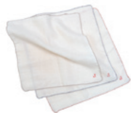
#65004 H-S-L ガーゼ ハンカチ 3枚組 ¥1,000 (税込¥1,050)