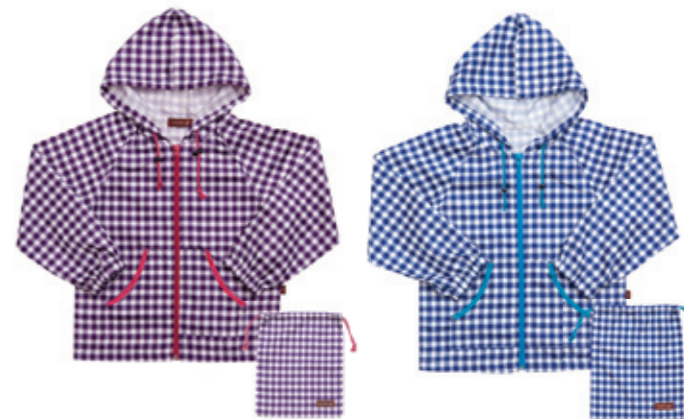
#65027 ギンガムチェック レインパーカー きんちゃく付 ¥2,900 (税込¥3,045)