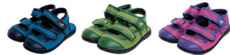
#75032 メッシュ サンダル ¥2,900 (税込¥3,045)

13.0, 14.0, 15.0, 16.0, 17.0, 18.0, 19.0cm 中国製