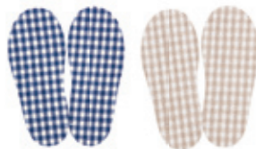
スタンプレインブーツにピッタリと合う インソール。サイズ調節や洗い替えに