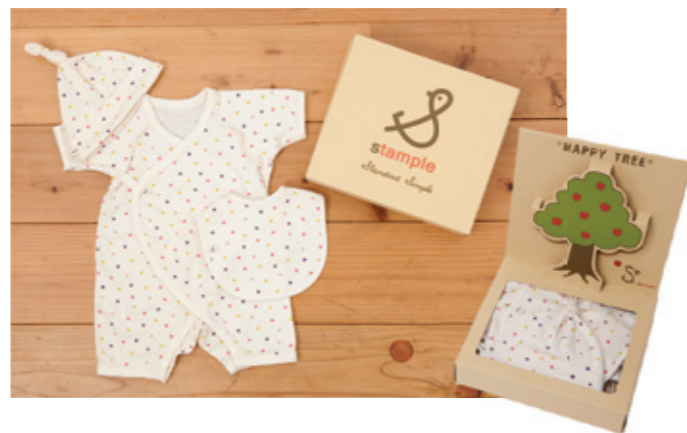
#95012 フライス ベビーギフト 3点+とび出すギフト箱 ¥4,900 (税込¥5,145)