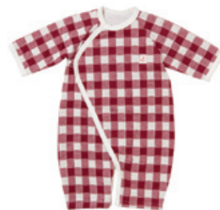
#25006 H-S-L チェック接続天竺 2WAY カバーオール ¥3,800 (税込¥3,990)

XXS (50-60cm) XS (60-70cm) 綿100% 日本製 秋冬春