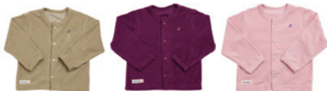
#45008 T/C パイル カーディガン ¥2,900 (税込¥3,045)