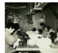
昭和30年頃の縫製室

昭和2年に和装下着の縫製工場として始まり、時代とともに和装から洋装へと移行。 その折、和装下着に使用していたガーゼで赤ちゃんの肌着を縫製したのがきっかけ となり、以後数多くのベビーアイテムの生産を手がけて現在に至る、歴史ある縫製 工場です。 現在の縫製室は、小規模ながらもベビーウェアの縫製にはかせないフラットシー マ (縫代が平に縫える特殊ミシン) など、多種多様なミシンが並び、常に職人による 手入れが行き届いています。