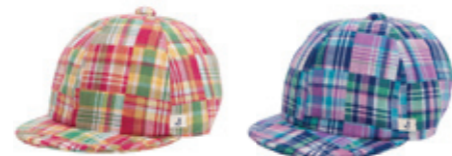
#65021 パッチワーク 二重織り ベビーキャップ ¥2,900 (税込¥3,045)