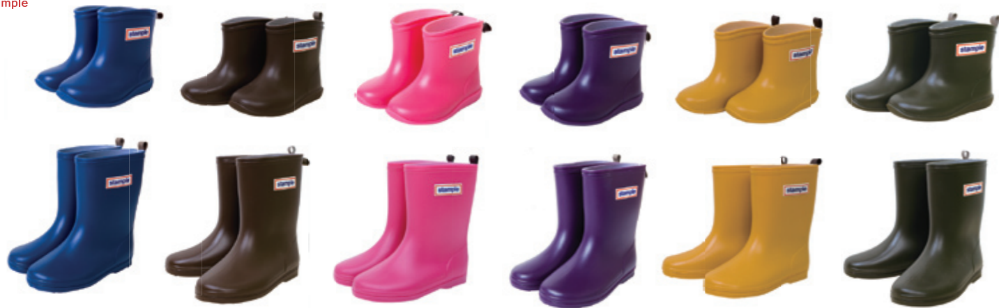
#75005 スタンプ レインブーツ ¥2,300 (税込¥2,415) ショート (13.0, 14.0, 15.0cm)、ミドル (16.0, 17.0, 18.0, 19.0cm) 日本製 55 ブルー、30 ブラウン、26 ピンク、60 パープル、37 マスタード、40 カーキ