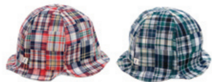
#65019 パッチワーク W ガーゼ ベビーチュールリップ ¥2,900 (税込¥3,045)